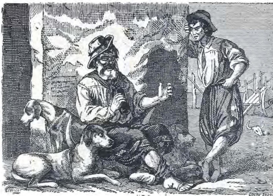
El viejo Viscacha dando sus consejos.

«Las armas son necesarias Pero naides sabe cuando; Ansina si andás pasiando, Y de noche sobre todo, Debés llevarlo de modo Que al salir, salga cortando.»