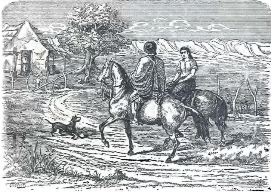
Vuelta de Martín Fierro

Me vine como les digo Trayendo esa compañera— Marchamos la noche entera Haciendo nuestro camino Sin mas rumbo que el destino Que nos llevára ande quiera.