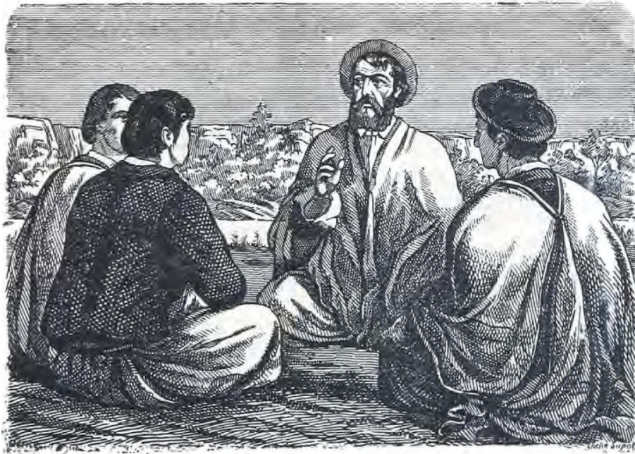
Martin Fierro dando consejos á sus hijos.

El trabajar es la ley Porque es preciso alquirit— No se espongan á sufrir Una triste situacion— Sangra mucho el corazon Del que tiene que pedir.