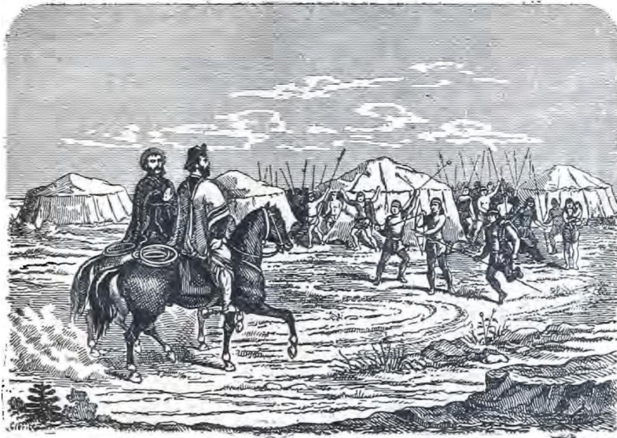
Llegada de Cruz y Fierro á las tolderías

Y las aguas serenitas Bebe el pingo trago á trago— Mientras sin ningun halago Pasa uno hasta sin comer, Por pensar en su mujer, En sus hijos y en su pago.