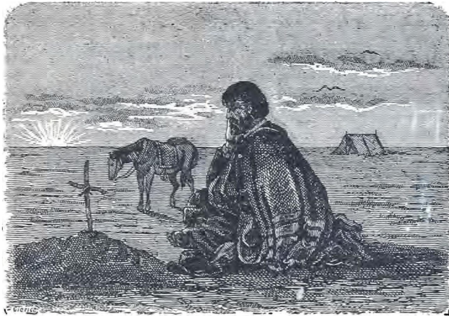
Martin Fierro meditando en la Tumba de su amigo Cruz

Andaba de toldo en toldo Y todo me fastidiaba— El pesar me dominaba Y entregao al sentimiento, Se me hacia cada momento Oir á Cruz que me llamaba.