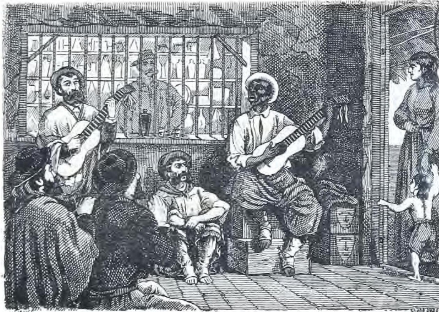
Canto por cifra, de contrapunto entre Martin Fierro y un negro.

Y le daré una respuesta Sigun mis pocos alcances — Forman un canto en la tierra El dolor de tanta madre, El gemir de los que mueren Y el llorar de los que nacen.