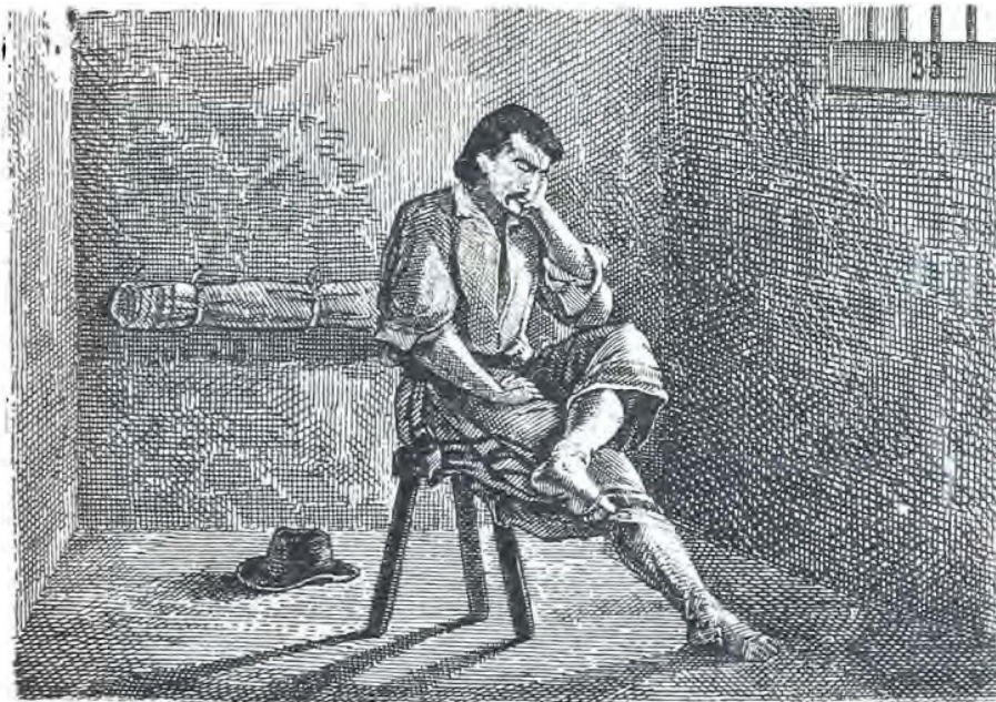
En la Penitenciaría

No es en grillos ni en cadenas En lo que usted penará, Sinó en una soledá Y un silencio tan profundo, Que parece que en el mundo Es el único que está.