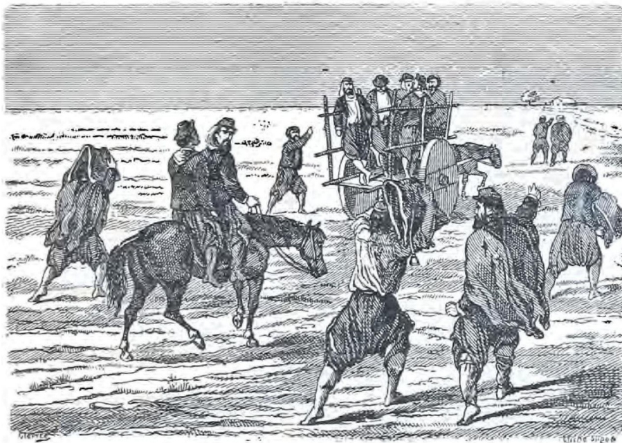
La vuelta del contingente.

Se me va por donde quiera Esta lengua del demonio— Voy a darles testimonio De lo que vi en la frontera. —Yo sé que el único modo A fin de pasarlo bien, Es decir á todo amen Y jugarle risa á todo.—