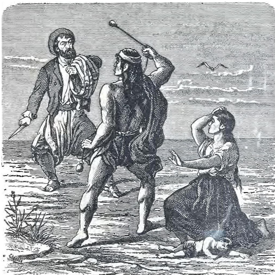
Pelea de Martin Fierro con un Indio

Y aunque de nuevo hizo pié Lo perdió aquella pisada; Pues en esa atropellada En dos partes lo corté.