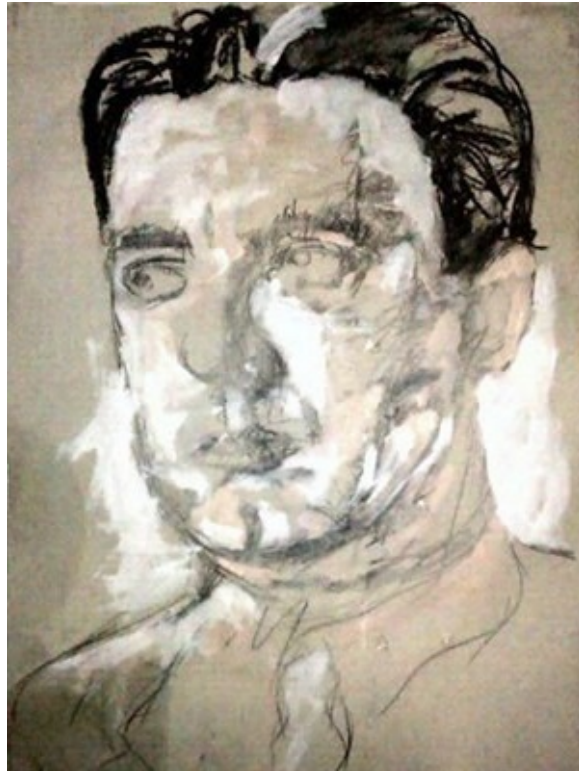
Dibujo de Héctor Herrero Rioja