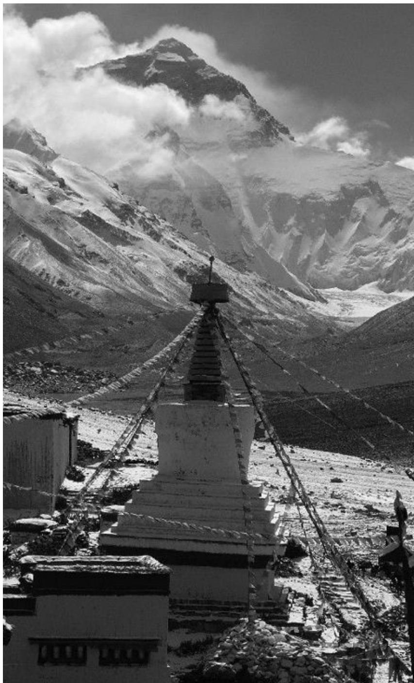
Vista del monte Everest desde el monasterio de Rongbuk.